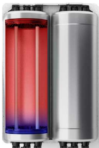
Nerezové vrstvené zásobníky s technológiou IsoDyn3

Vďaka najnovšej verzii IsoDyn3, inteligentnej technológii nového kotla Tiger Condens, sa kotol dokáže učiť podľa zvykov vašej domácnosti a rozpozná, kedy a v akom množstve teplú vodu najviac potrebujete.