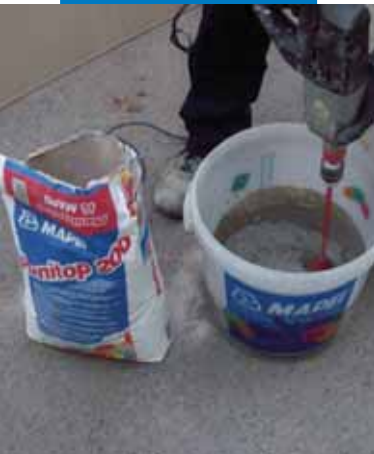
Příprava Planitopu 200

Informace o tomto výrobku jsou k dispozici na požádání a na stránkách www.mapei.cz , www.mapei.it a www.mapei.com