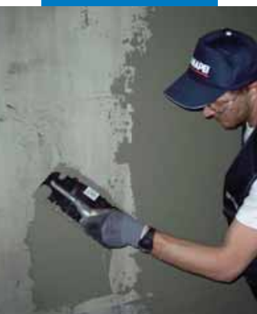
Nanášení Planitopu 200 na betonový podklad