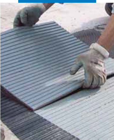
Inštalácia sklenenej mozaiky bielym lepidlom Granirapid