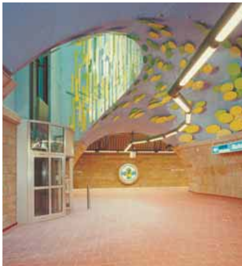
Príklad inštalácie žuly s lepidlom Granirapid v podchode v Mulheim Ruhr, Nemecko.