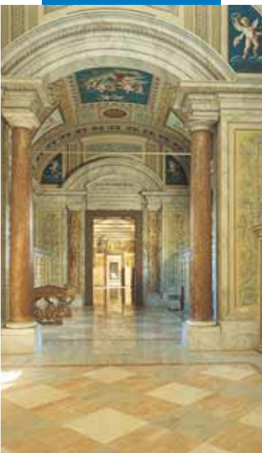
Príklad inštalácie žuly s lepidlom Granirapid Vatikán - Rím

podklad so zubovou stierkou č.6. Potom uložte dosku „čerstvé do čerstvého“.