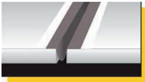
Umiestnenie pásky Mapeband PE120 v tvare Ω v mieste dilatáčnej škáry.