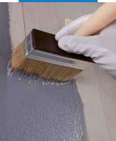
Aplikácia Eco Prim Grip Plus na betón so štetcom