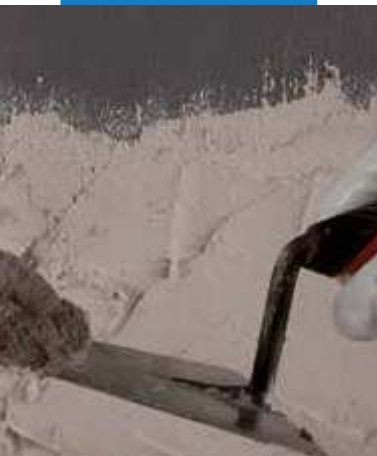
Aplikácia omietky na Eco Prim Grip Plus