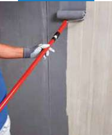
Aplikácia Eco Prim Grip Plus na betón s valčekom