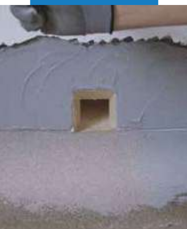
Zaizolovanie odtokovej vpuste s Drain Front