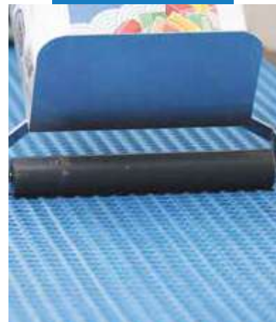
Zatlačenie Mapeguard UM 35