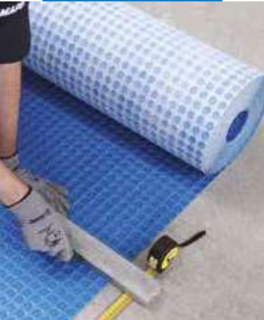
Narezanie Mapeguard UM 35