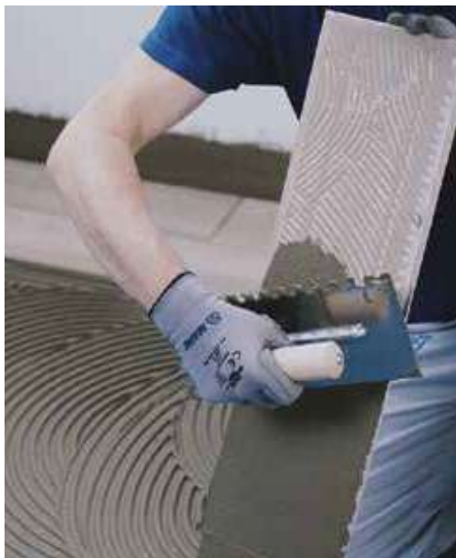
Lepenie keramickej alebo kanenej dlažby použitím lepidla Mapei (min. trieda C2) v závislosti od formátu dlažby