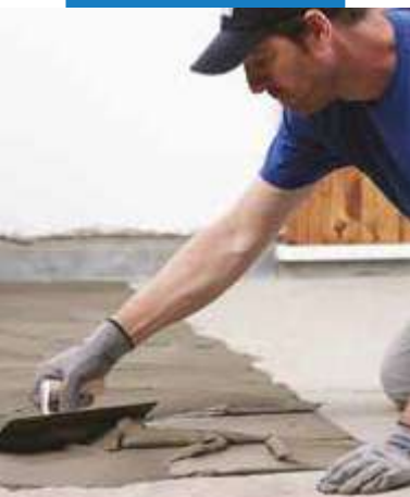
Aplikácia lepidla s použitím zubovej stierky č.5