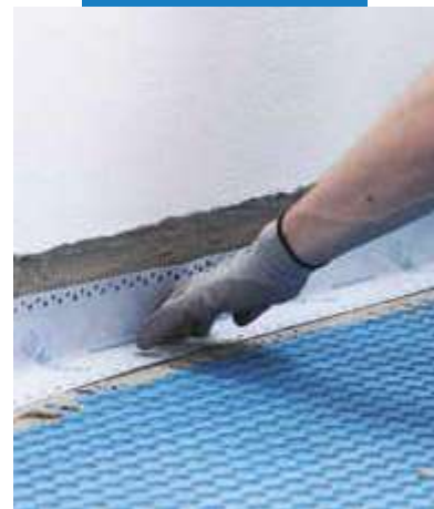
Zaizolovanie škáry v styku-stena podlaha s páskou Mapeband Easy nalepenou do Mapeguard WP Adhesive