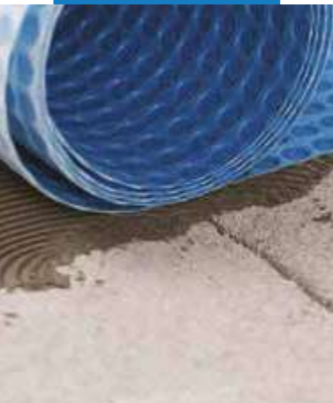
Inštalácia Mapeguard UM 35