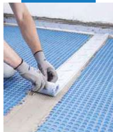
Zaizolovanie škáry vzniknutej medzi príhlými pásmi s použitím pásky Mapeband Easy nalepenej do Mapeguard WP Adhesive