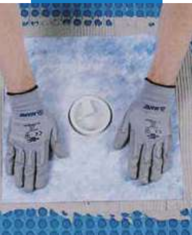
Zaizolovanie odtokovej vpuste s Drain Vertical/ DrainLateral

Príslušné odkazy na produkt sú k dispozícii na vyžiadanie alebo na www.mapei.sk a www.mapei.com