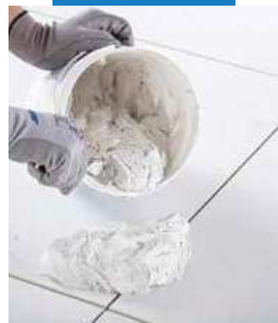
Krémová konzistencia správne namiešanej malty

Pri čistení rozsiahlych podlahových plôch povrch navlhčíte a použijete výkonné rotačné zariadenie so špeciálnymi abrazívnymi diskami podobnými ako Scotch-Brite®. Nadmerné