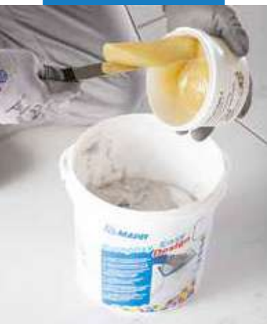
Nalejte tvrdidlo (zložka B) do zložky A