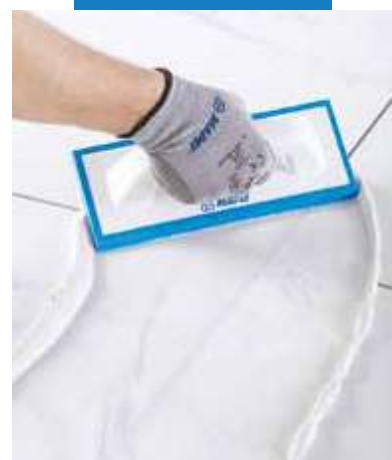
Lahké rozprestretie epoxidovej škárovacej malty