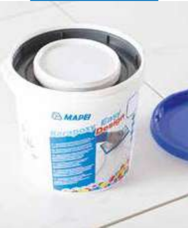
Kerapoxy Easy Design sa dodáva vo vedre obsahujúcom zložku A a zložku B