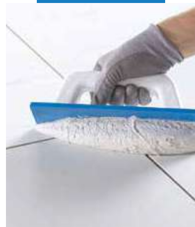
Aplikácia Kerapoxy Easy Design s gumovou stierkou MAPEI