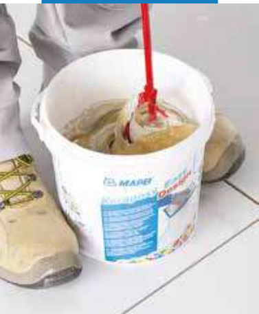
Miešanie zložiek (A+B)

metalizujúceho efektu, ktorý sa dodáva vo vopred navážených vreciach po 90 gramov, čo zodpovedá 3 % (hmotnostne) z 3 kg balenia Kerapoxy Easy Design. Mapecolor Metallic je dostupný vo farebných odtieňoch Moonlight (podobné ako Planinum), Sahara (podobné k zlatej), Shining (podobné k striebornej), Red Clay (podobné k medenej) a Stardust (podobné k tmavo striebornej). Za účelom získania homogénnej zmesi sa odporúča pridať Mapecolor Metallic zelenej farby do Kerapoxy Easy Design 700 (priesvitná). Zmiešaním Mapecolor Metallic s Kerapoxy Easy Design je možné získať široké spektrum metalizujúcich efektov s rozdielnou intenzitou a tieňmi. V každom prípade sa odporúča vždy najskôr vykonať skúšobný test, pretože výsledný odtieň je výrazne ovplyvnený vybranou farbou a aplikovaným množstvom. V každom prípade sa pridáva do zmesi max. 3% (hmotnostne) tak, aby neprišlo k zmene spracovateľnosti malty.