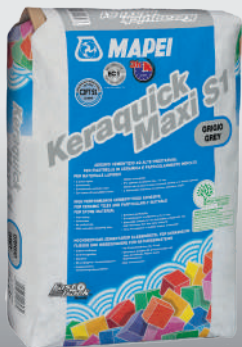
Keraquick Maxi S1 šedý