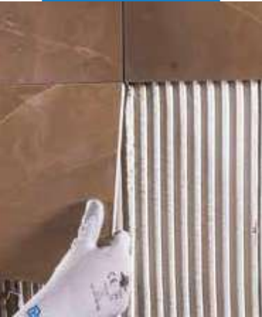
Lepenie obkladu na steny