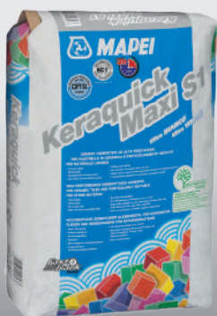
Keraquick Maxi S1 biely

ponorenie do čistej vody. Pred lepením nechajte vyschnúť.