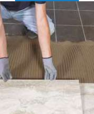
Lepenie kameňa na existujúcu keramickú dlažbu