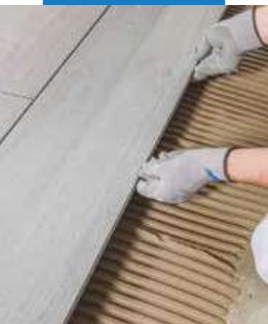
Lepenie dlažby na podklad zaizolovaný s hydroizoláciou Mapelastic