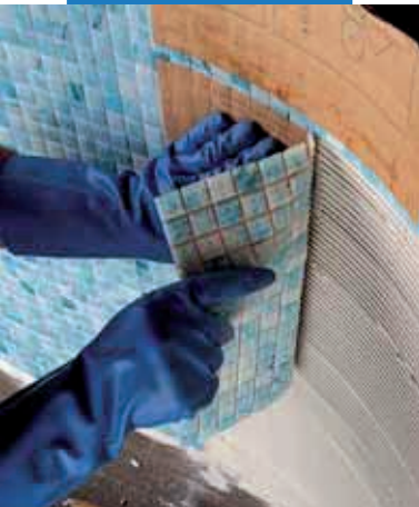
Inštalácia sklenenej mozaiky 2x2 cm v plaveckom bazéne s lepidlom Adesilex P10 zmiešaným s prísadou Isolastic a vodou v pomere 1:1

Steny môžu byť škárované po 4-8 hodinách a podlahy po 24 hodinách použitím vhodných cementových alebo epoxidových škárovacích mált Mapei, ktoré sú dostupné vo viacerých farebných odtieňoch.