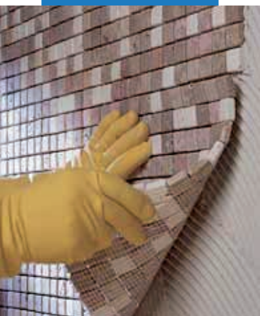
Inštalácia mramorovej mozaiky na stenu