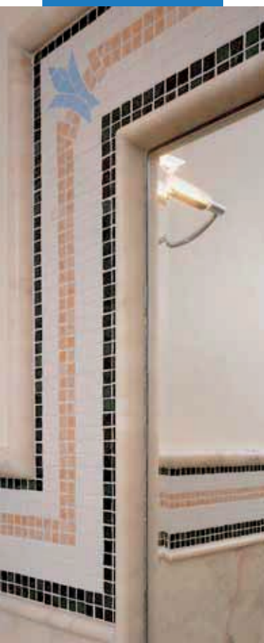
Príklad dekorácie s mozaikou z rôznych materiálov

Informácie o tomto výrobku sú k dispozícii na požiadanie a na webových stránkach www.mapei.sk a www.mapei.com .