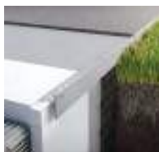
Terasový profil STONE