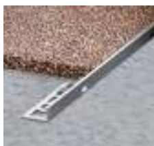
Ukončovací profil STONE "L"

Zvislé plochy pripravte tak, že zmiešate Koberec z prírodného kameňa PU 1K s 6 - 8% Tixotropná prísada SN 1K a ako základný náter naneste túto hmotu na podklad špachtlou.