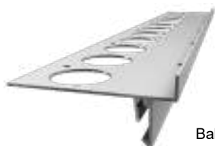
Balkónový profil STONE "L"

Koberec z prírodného kameňa PU 1K s pridaním 6-8% Tixotropnej prísady SN 1K zmiešajte s mramorový piesok MG 24 (MG36) vo váhovom pomere 1 : 10 (napr. 1,25 kg PU 1K + 6-8% SN 1K : 12,5 kg MG 24 ). Zmes nanášajte na pripravený podklad spôsobom mokrý do mokrého. Preto je potrebné naniesť zmes do cca 30-45 minút od prípravy podkladu.