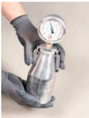
Meranie zvyškovej vlhkosti

Priemerná nameraná hodnota prídržnosti = 1,5 N/mm 2 (prídržnosť - pevnosť v ťahu) Najnižšia nameraná hodnota prídržnosti = 1,1 N/mm 2