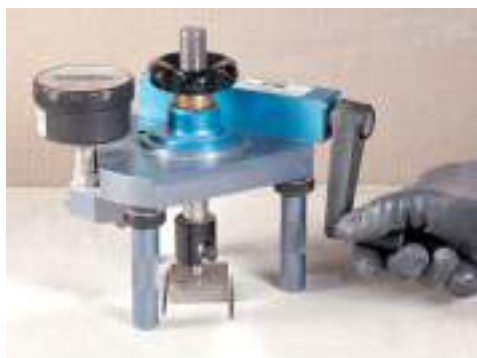
Meranie prídržnosti (pevnosti v ťahu)