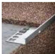
Schodiskový profil STONE