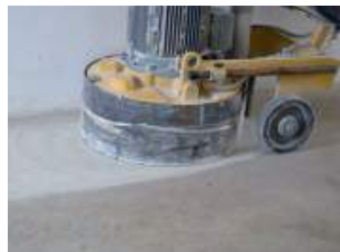
Úprava povrchu brúsením